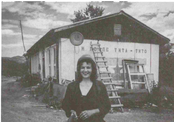
Једна од изложених фотографија ауторке Марије Ђоковић

Изложба ће бити постављена до 16.августа.