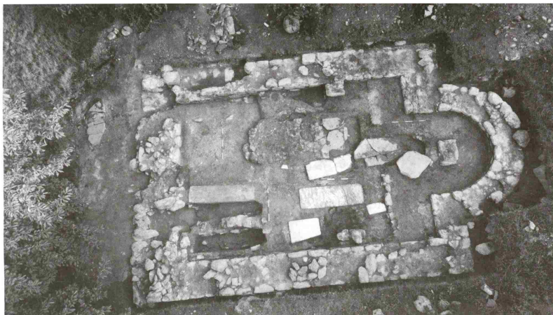
Основа цркве на нивоу пода са надгробним обележјима

МЕТАЉКА У ЗАГРАЂУ НАЈЗНАЧАНИЈЕ АРХЕОЛОШКО ОТКРИЋЕ У СРБИЈИ У 2022. ГОДИНИ